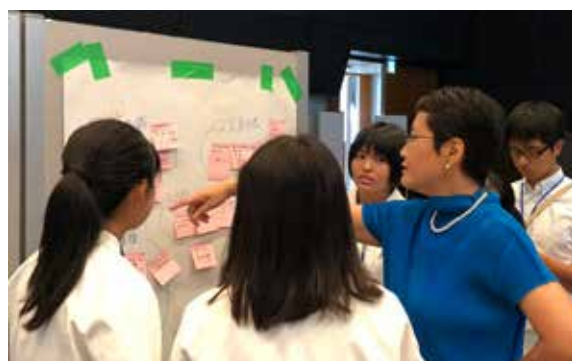
フィードバックの様子