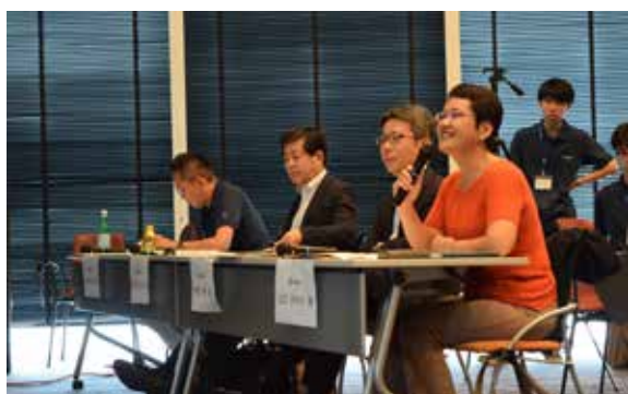
最終プレゼンテーションでの質疑応答

「参加してくれた高校生には、イノベーションの学びや楽しさ、その効果を他の大人や高校生に伝えていってほしい。」