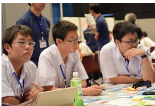
本大会ワークショップの様子

本大会では「日常的にも災害時にも役に立つグッズを考える」をテーマに、主催側が設計したワークショップに基づいて各チームがアイデア発想に取り組みました。本大会は8月18日（土）および19日（日）に東京大学武田ホールで開催され、1日目は事前課題として高校生に「防災の課題」「普段から使っている日用品」について考えてきてもらったことを元にしたワークショップを、2日目は考えたグッズの最終発表を行いました。なお最終発表で各チームにはグッズの説明と共に、使用するシーンについてのスキット（寸劇）で自分たちのアイデアを伝えてもらいました。