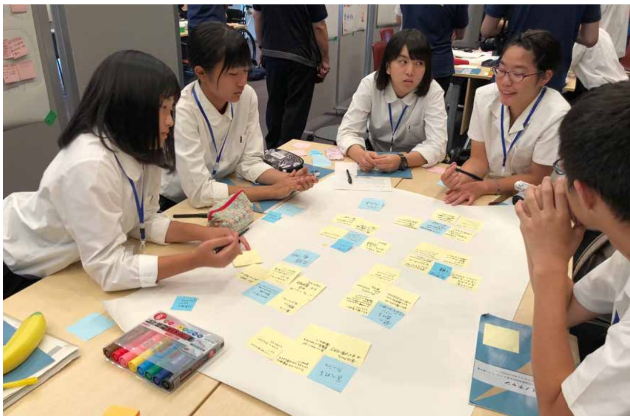
本大会ワークショップでの議論の様子

全国高校生社会イノベーション選手権（以下イノチャンと表記）は、イノベーションを学び実践する場を高校生に提供することを目的として設立された大会です。第一回大会には全国 11 チームから応募があり、そのうち一次審査を通過した 9 チームが 8 月 18 日（土）および 19 日（日）に東京大学武田ホールで開催された本大会に出場しました。本大会では「日常的にも災害時にも役に立つグッズを考える」をテーマに、主催側が設計したワークショップ（WS）に従ってアイデア発想に取り組みました。高校生にとっては普段の授業では扱わないような課題に悪戦苦闘する姿も見て取れましたが、どのチームも仲間と協力して最後には甲乙つけがたい素晴らしいアイデアを創出することができました。