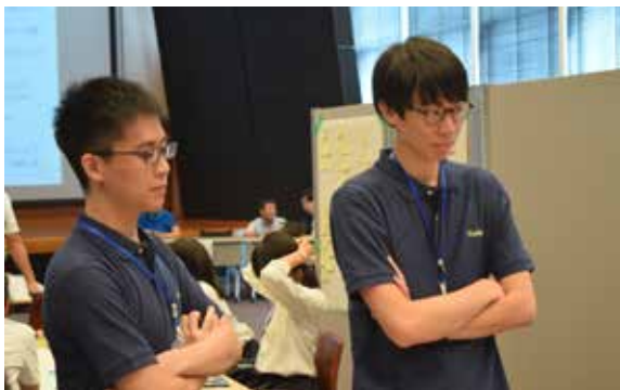
ワークショップ中の学生アシスタント

「大会の設計、運営においては当然苦労もありましたが、本大会が高校生を対象にしている点で特に大きなやりがいを感じられたように思います。私たちと同様に今後の日本を担う世代でありながら、発想の柔軟さ・何でも吸収できる素直さを持ち合わせた高校生と一緒に防災のイノベーションを考えるのは純粹に楽しかったです。最終的なアイデアも高校生ならではの良さが光るものばかりで、ワークショップの設計に携わった一員として喜びもひとしおでした。」