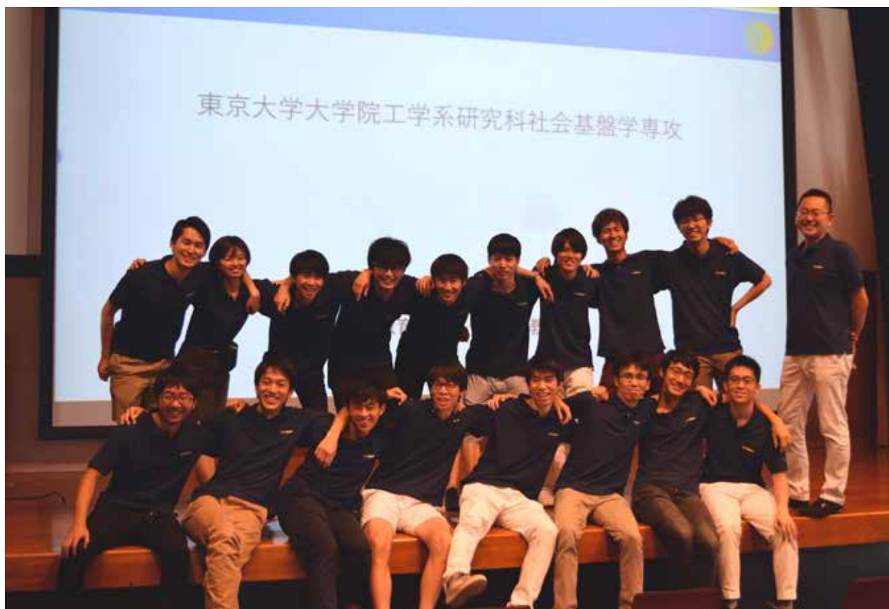
実行委員会のメンバーと大会プロデューサー

本大会は全国高校生社会イノベーション選手権実行委員会によって実施されました。実行委員会は東京大学大学院工学系研究科社会基盤学専攻及び東京大学工学部社会基盤学科に所属する学生有志20名（修士課程6名、学部課程14名）により構成されています。昨年の10月に実行委員会が設立され、大会開催に向けた運営が始動しました。プロジェクト全体を統括する「運営班」、大会の経理を管理する「会計班」、大会の課題やワークショップを設計する「レギュレーション班」、高校やメディアへの広報を行う「広報班」、大会スポンサーを募る「協賛班」、審査員への依頼や対応を行う「審査員班」、ポスターやホームページをはじめとしたデザインを行う「デザイン班」などの部署が設置され、各部署が互いに連携をとりながらイノチャンの設計を行いました。第一回大会ということで学生らにとっても初の試みであったイノチャンですが、学科の教員や共催団体の関係者、その他大学内外様々な方からの助言や支援を得て、第一回大会を開催することができました。