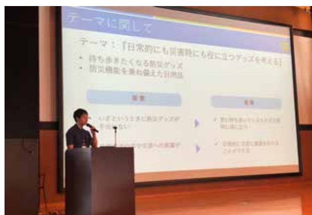
大会テーマ発表の様子